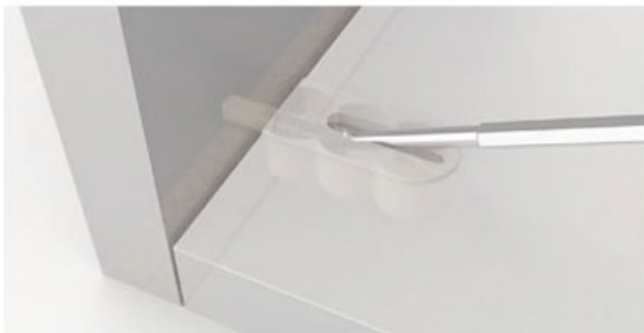
Grande force de serrage