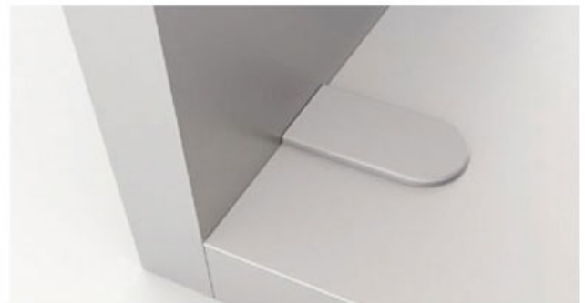
Panneaux à partir de 12 mm