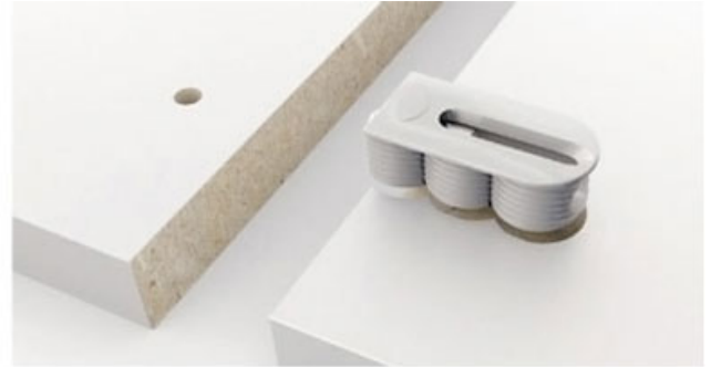
Pas de trous pour cheville