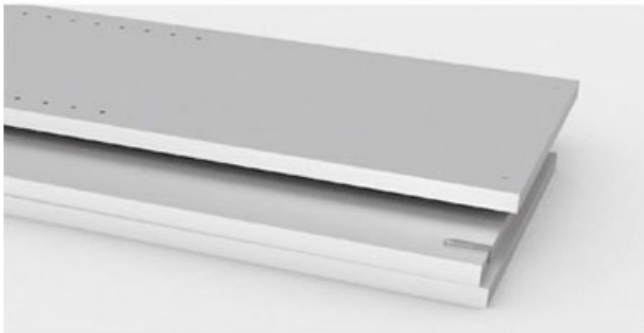
Monobloc + prémonté