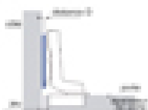
1 - Distance de hauteur C